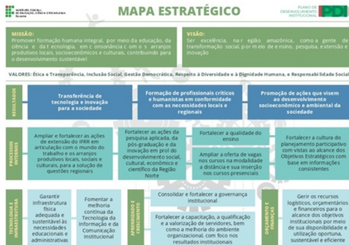
Figura 2 – Mapa Estratégico 2019-2023 do IFRR

Fonte: Plano de Desenvolvimento Institucional (PDI)